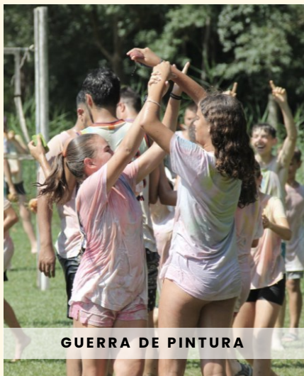
GUERRA DE PINTURA