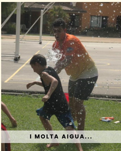
I MOLTA AIGUA...