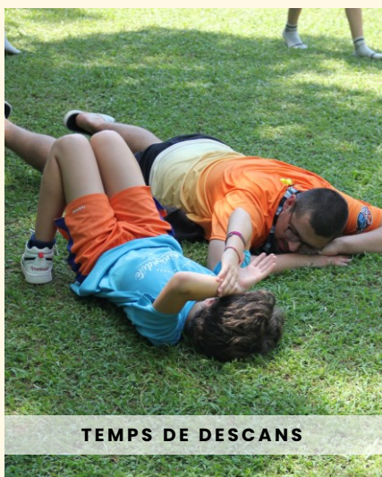
TEMPS DE DESCANS