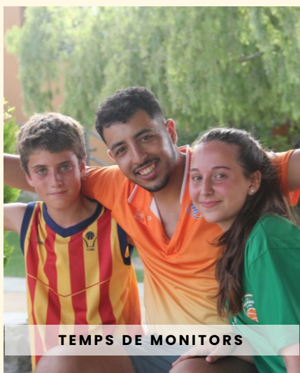
TEMPS DE MONITORS