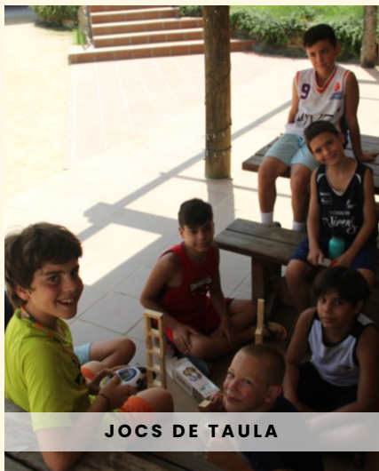
JOCS DE TAULA