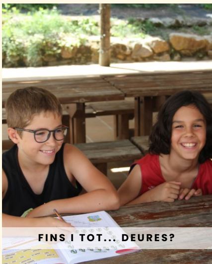
FINS I TOT... DEURES?